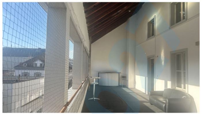
Terrasse 48 qm